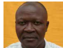
HIIH NYOI, Chef de quart embauché le 23/08/1980