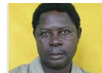
KANNANG , Cariste embauché le 22/01/1985